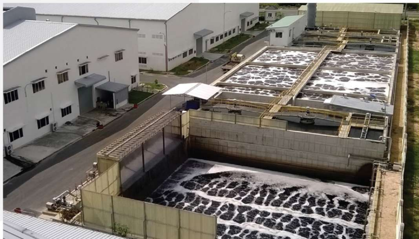
Vị trí dự án Công suất (m 3 /ngày) Location Capacity (m 3 /day) Tân Tạo IP, Nhơn Trạch 6.000 Tan Tao IP, Nhon Trach 6.000