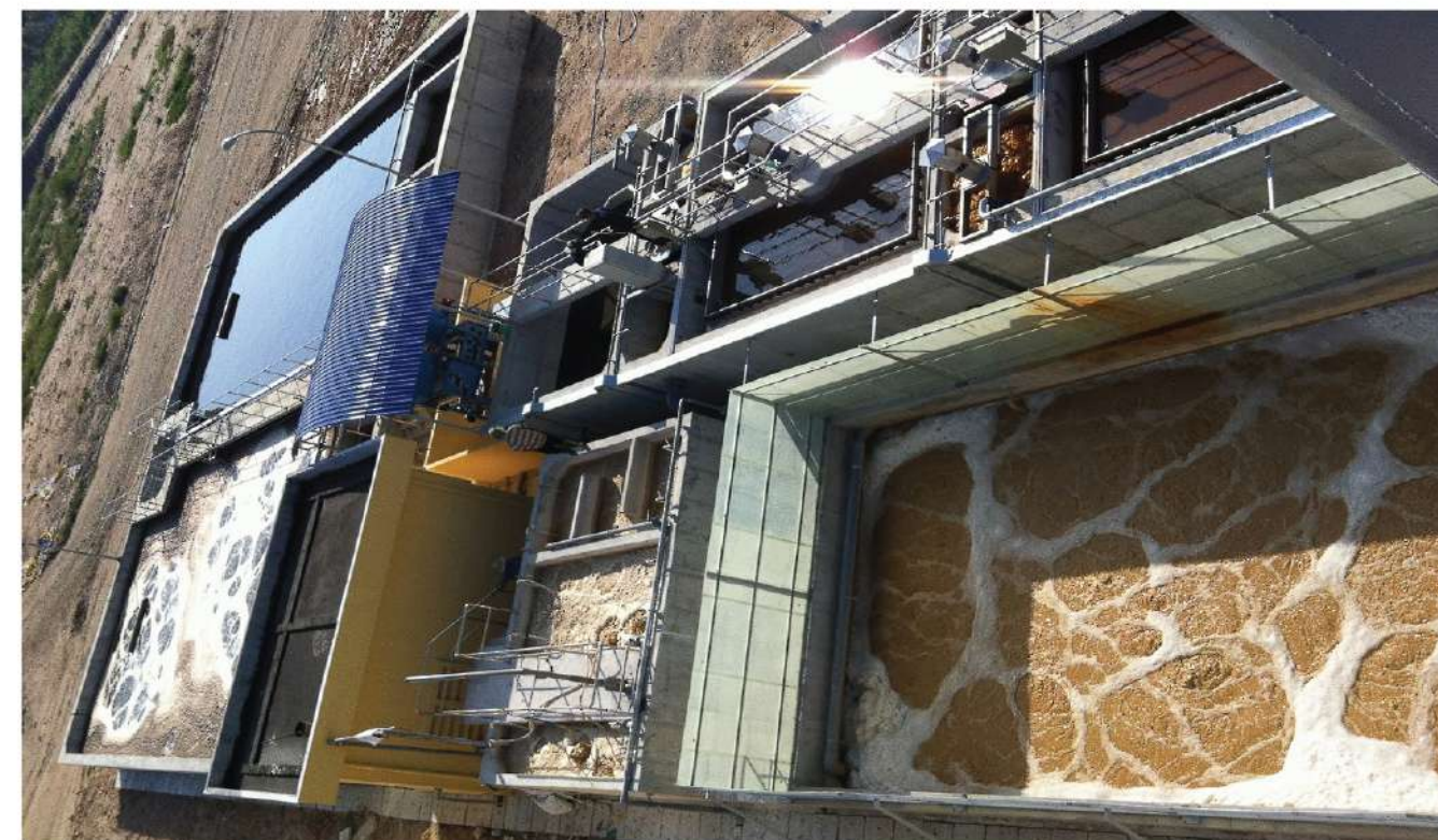
Vị trí dự án Công suất (m 3 /ngày) Location Capacity (m 3 /day) Tân Thành, Bà Rịa- Vũng Tàu 400 Tan Thanh, Ba Ria- Vung Tau 400