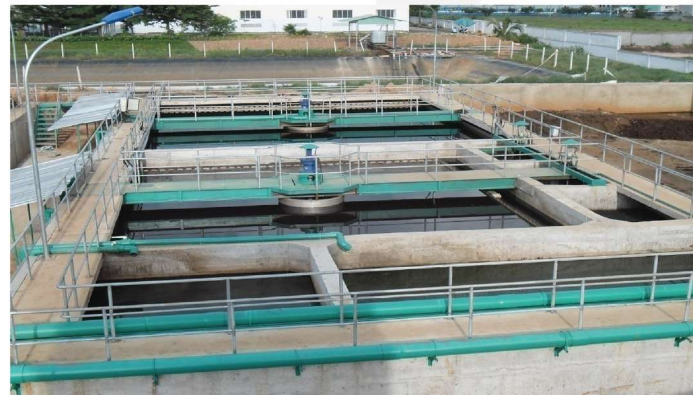
Vị trí dự án Công suất (m 3 /ngày) Location Capacity (m 3 /day) Phú Quốc, Kiên Giang 2,000 Phu Quoc, Kien Giang 2.000