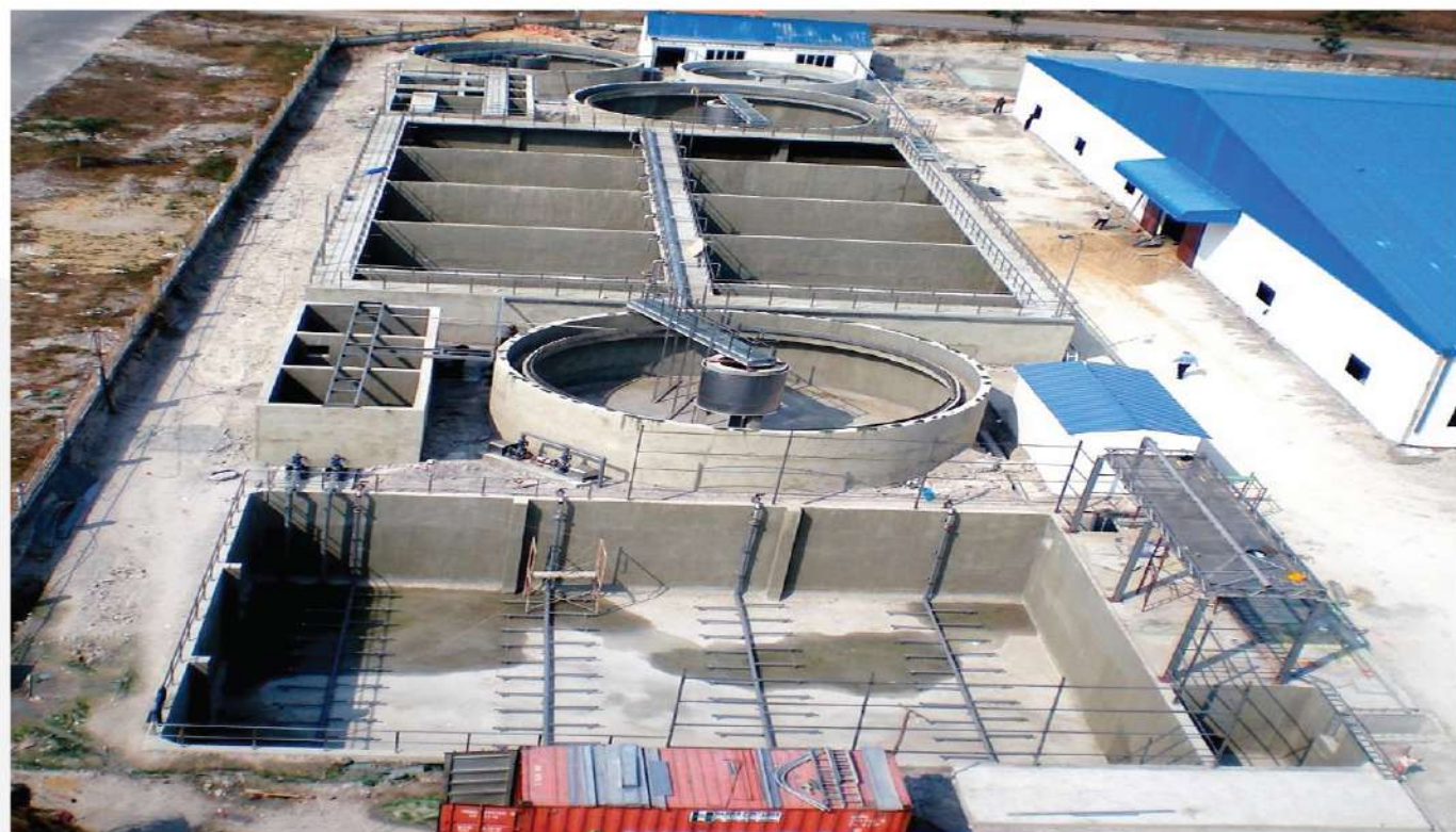
Vị trí dự án Công suất (m 3 /ngày) Location Capacity (m 3 /day) Minh Hung IP - Binh Phuoc 2,900 Minh Hung IP - Binh Phuoc 2.900